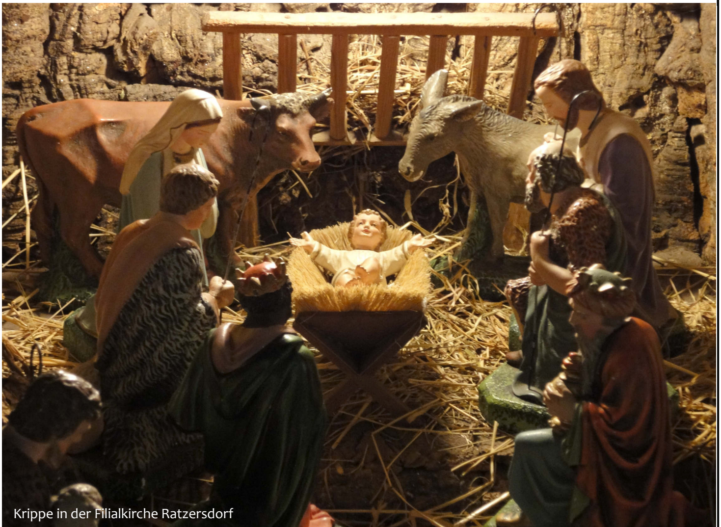
Krippe in der Filiationkirche Ratzersdorf

Wir wünschen Ihnen eine besinnliche Adventzeit, ein gesegnetes Weihnachtsfest und Gottes Segen und Gesundheit für das Jahr 2021!